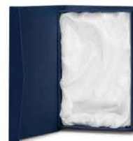
Scatola regalo Gift box