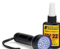
Lampada e colla UV UV lamp and glue